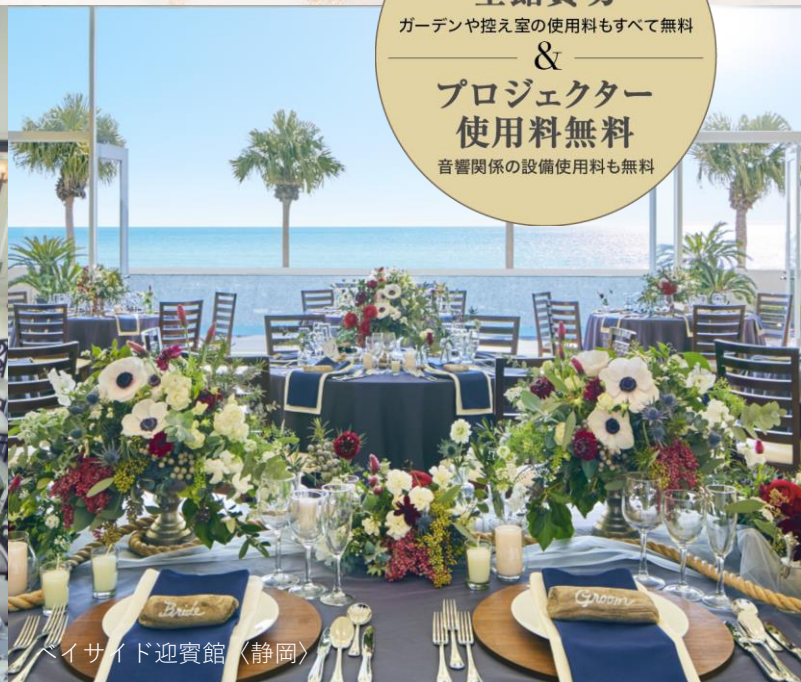
ベイサイド迎賓館 (静岡)