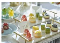
デザートブッフェ