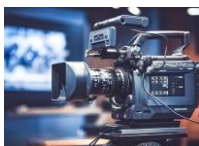
映像商品 (エンドロールなど)