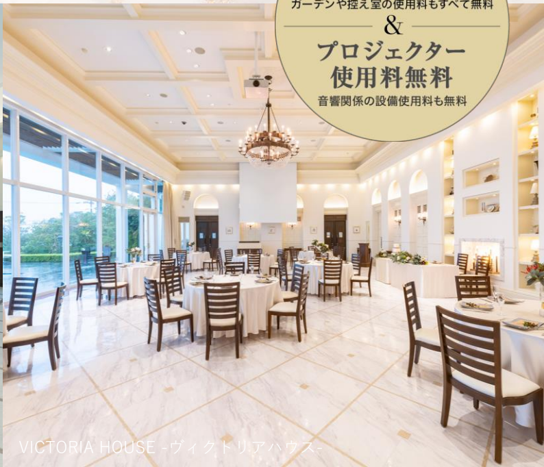
VICTORIA HOUSE -ヴィクトリアハウス-