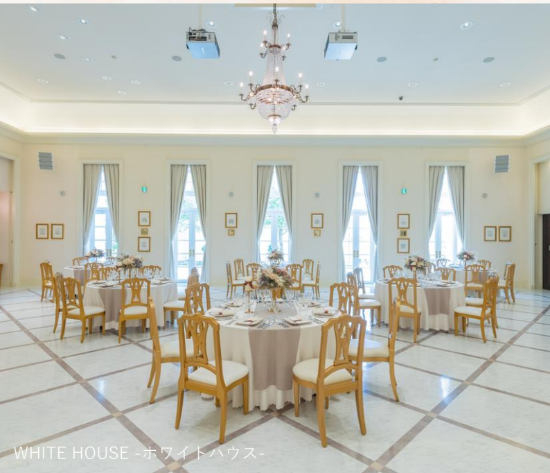
WHITE HOUSE -ホワイトハウス-