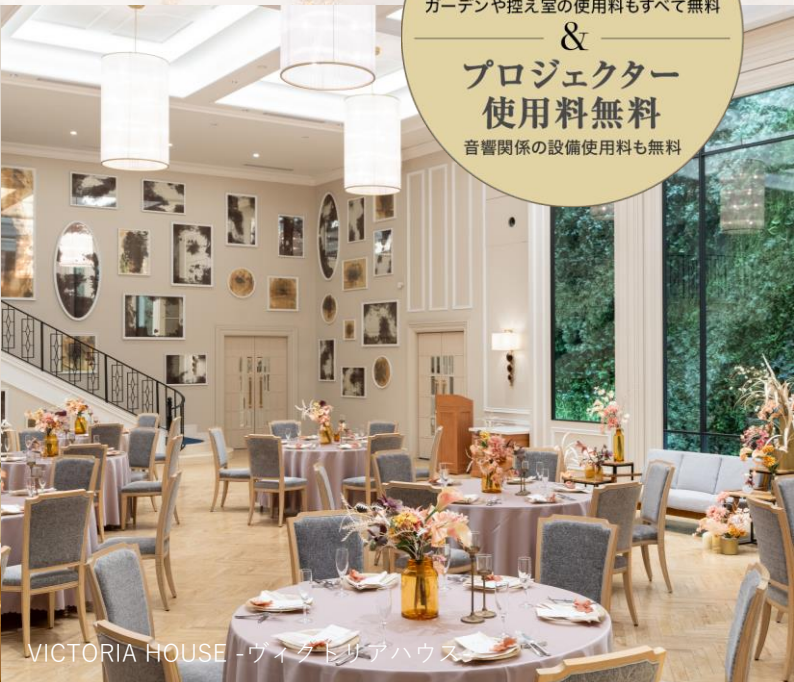
VICTORIA HOUSE -ヴィクトリアハウス-