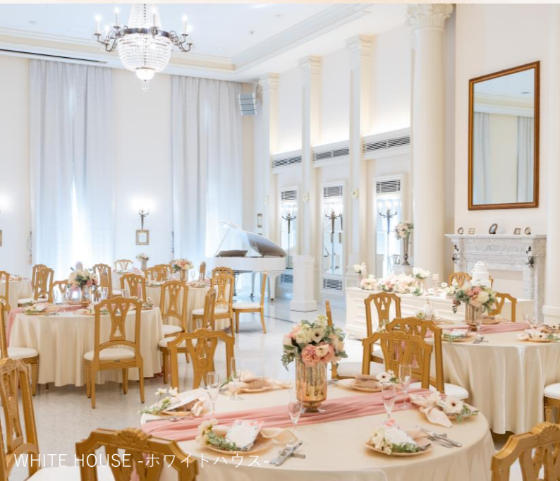
WHITE HOUSE -ホワイトハウス-